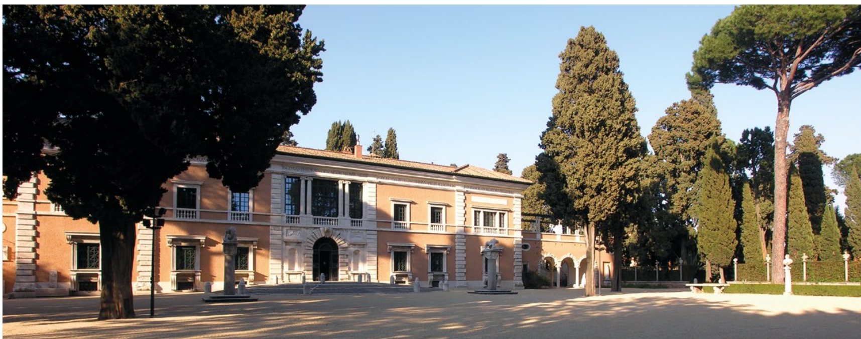
Das Hauptgebäude der Villa Massimo.

durchführen können, spreche ich gerade mit ehemaligen Rompreisträgern, mit Experten der Neuen Medien, mit Urbanisten und Soziologen, um gemeinsam neue Ideen für neue Formate zu entwickeln. Die Rompreisträger vor Ort diskutieren täglich darüber, wie es nach dem Vakuum weitergeht. Klar ist, dass wir uns in dieser Zeit vermehrt mit künstlerischen Arbeiten auseinandersetzen wollen. Das soll sich auch in unseren finanziellen Ausgaben spiegeln. Wir verzichten vielleicht in Zukunft noch mehr auf ausschweifendes Catering und investieren besser in Künstlerhonorare.